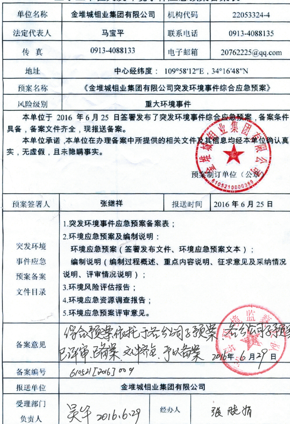
企事业单位突发环境事件应急预案备案表